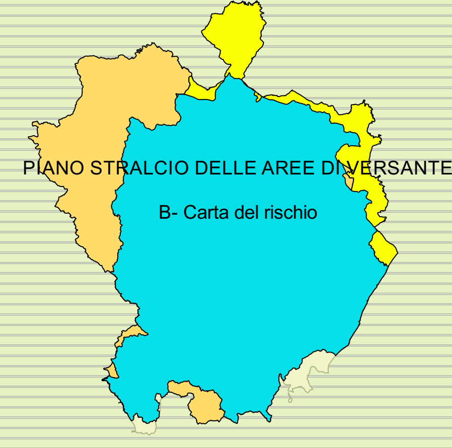
PIANO STRALCIO DELLE AREE DIVERSANTE B- Carta del rischio

Ristampa con aggiornamento Novembre 2022 scala 1:25000 Tavola n. 14